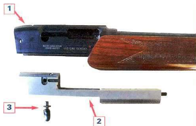
Рисунок С: 1 - Корпус 2 - Затвор 3 - Рычаг перезарядки

Затвор (2) снабжен пружиной, экстрактором, молотком с бойком и пружиной возврата с направляющей. Для транспортных целей также как для операции сборочная система затвора крепится с поперечным рычагом перезарядки (3).