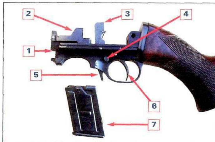
Рисунок В: 1 - спусковой механизм 2 - Защелка Затвора 3 - курок 4 - предохранитель 5 – защелка магазина 6 – спусковой крючок 7-магазин

Блок спускового механизма (1) состоит: курок (3) , спусковой крючок (6), предохранитель (4). В блоке спускового механизма имеется основание для вставки магазина(7) и пружины защелки магазина(5). Центральный болт служит, чтобы подсоединить торец к спусковому механизму.